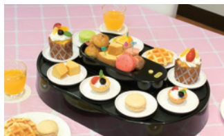
スイーツやお菓子なども楽しめます