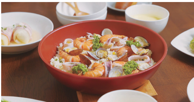
ハンドルを外してそのまま食卓へ

キズに強く、こびりつきにくい内面ふっ素樹脂加工+ダイヤモンドコート のフライパン・ポットセット。耐摩耗性試験100万回クリア。内面のPAD 印刷が浮かび上がったらず熱完了のサインです。シリコン樹脂塗装で 握りやすいハンドルは取り外し可能ですので、お皿の代わりにそのまま 食卓に並べることができ、使わない時はコンパクトに収納できます。ハン ドルは1アクションで簡単に取り付けでき安心の安全ロック付き。