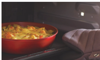
ハンドルを外してオープン調理もできます