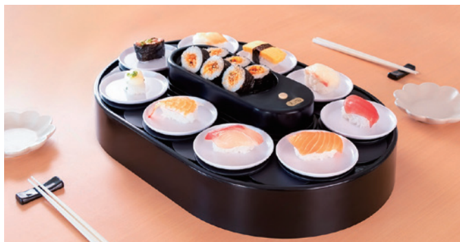
本格的な回転寿司パーティーが楽しめます

手作りのお寿司やテイクアウトのお寿司をご自宅で回転寿司のよう に楽しめる「我が家の回転寿司」。いつもの食事に楽しみをプラスし てくれるアイテムです。お寿司以外にもスイーツやお菓子などの食 材を乗せて楽しむことができ、誕生日のお祝いやクリスマス等特別 な一日にも大活躍な商品です。ぜひおうち時間をお楽しみください。